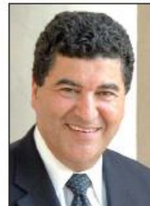
Elias A. Zerhouni, M.D. Bethesda, Md.